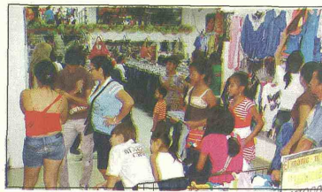
Según la encuesta de Fenalco, el invierno fue un tema determinante en el comportamiento del consumo en diciembre. Los cierres de las vías afectaron varios renglones del comercio.

Según el gremio de los comerciantes, mientras que en diciembre del año 2010, 46% de los consultados por Fenalco logró aumentar su volumen de ventas, frente a las obtenidas en igual mes del año 2009, para diciem-