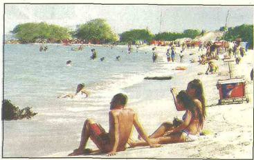
La temporada de vacaciones en el Golfo de Morrosquillo cerró con una ocupación hotelera del 50 %.

"En mi hotel hay reservas para un día nada más y sólo en 3 habitaciones de las 24 que tengo" afirmó. Según la Oficina de Tu-