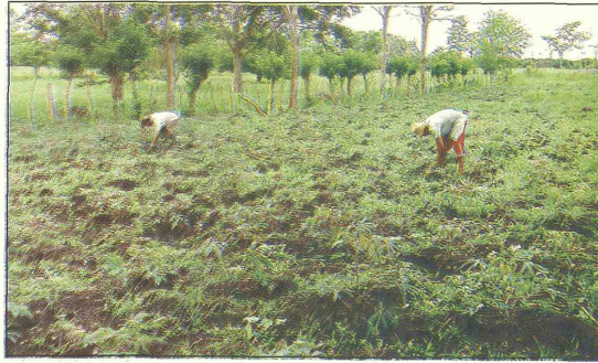
Si la negociación con la empresa lechera prospera, la Planta de Almidones de Sucre se verá obligada a aumentar el valor que paga por la yuca.

Indicó que miembros del sector participarán en un proyecto grande de