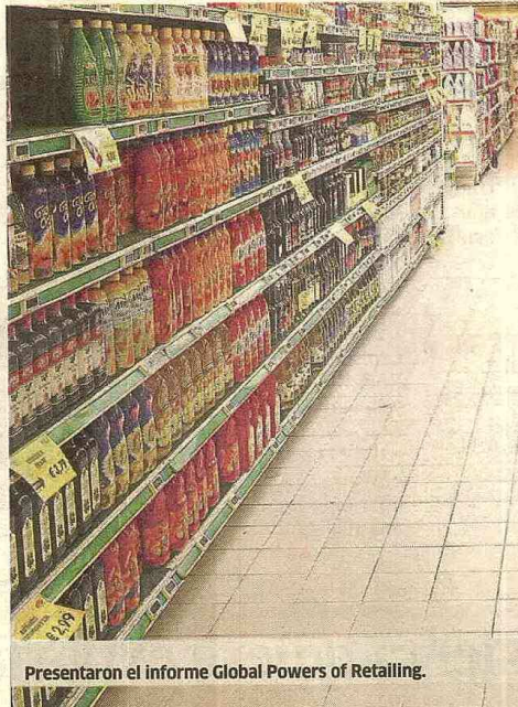
Presentaron el informe Global Powers of Retailing.

“La recesión mundial afectó las ventas al por menor a nivel general y un tercio de las compañías vieron disminuir sus ingresos”, dijo un analista de Deloitte al diario La Vanguardia , de España. Sin embargo, la rentabilidad de las mayores empresas del comercio minorista del orbe aumentó de 2,4 por ciento a 3,1 por ciento. La investigación también concluye que debido a la crisis financiera del 2009, que aún tiene coletazos en el mundo, las ventas disminuyeron en cuatro de las 10 empresas de comercio más grandes del mundo; otras tres tuvieron incrementos de menos de uno por ciento. =